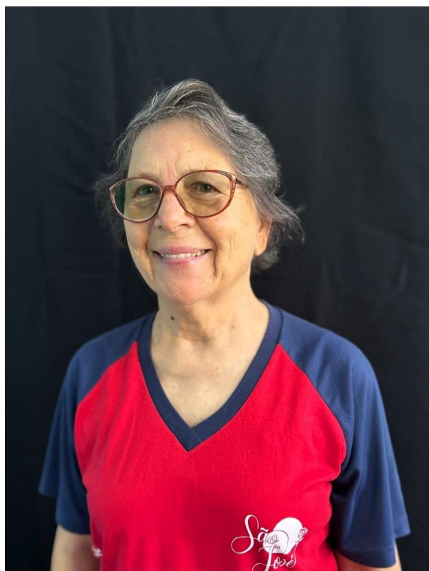
1 - Representante da Mantenedora